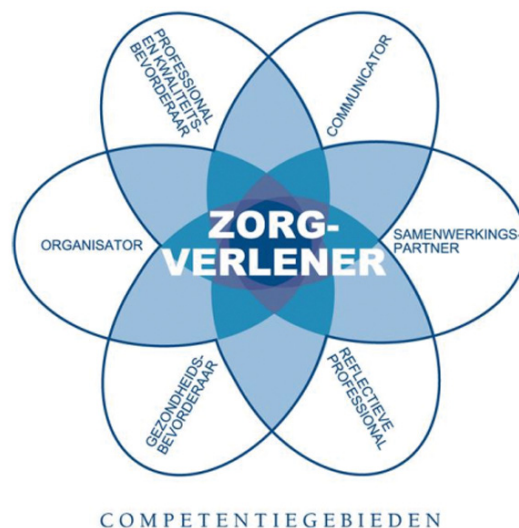
Figuur 1. CanMEDS-systematiek

In de Inleiding is al genoemd dat het Expertisegebied kinderverpleegkundige beschouwd dient te worden als een aanvulling op het Beroepsprofiel verpleegkundige (Lambregts & Grotendorst, 2012). Het Beroepsprofiel beschrijft de elementen van het beroep die voor iedere opgeleide verpleegkundige van toepassing zijn en dus ook voor de verpleegkundigen die onder een Expertisegebied vallen. Om de verbinding tussen het Beroepsprofiel en het Expertisegebied duidelijk te maken, komen de kennis en vaardigheden uit het Beroepsprofiel terug in het Expertisegebied. Vervolgens worden vanuit deze basis de aanvullende kennis, vaardigheden en attitude van de kinderverpleegkundige beschreven. Dit alles wordt uitgewerkt aan de hand van de CanMEDS-systematiek (Canadian Medical Education Directions for Specialist). Deze systematiek bestaat uit zeven verschillende rollen en is vertaald voor de verpleegkundige. De kern van de beroepsuitoefening is de verpleegkundige als zorgverlener. Alle andere rollen raken aan die centrale rol. De rol van zorgverlener geeft richting aan de andere CanMEDS-rollen. In het adviesrapport 'Bachelor Nursing 2020' is een schematische weergave van CanMEDS versus competenties 17 .